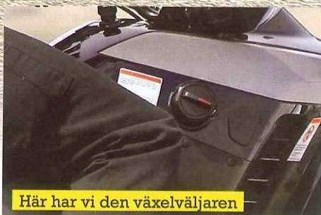
Här har vi den växelväljaren